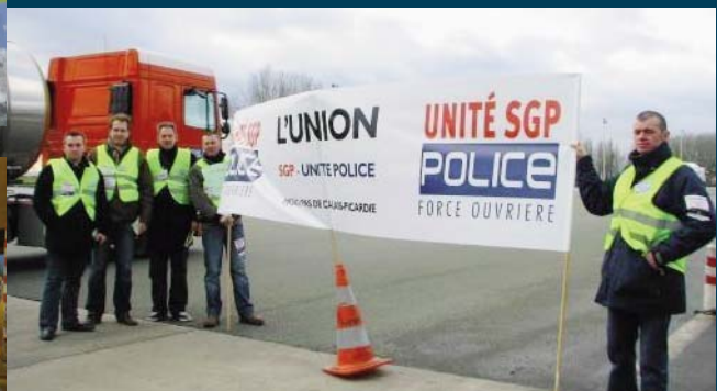
A Chamant !