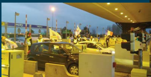
A Mantes-La-Jolie !

«On vous soutient», a très probablement été la phrase la plus entendue par ceux qui distribuait les tracts.