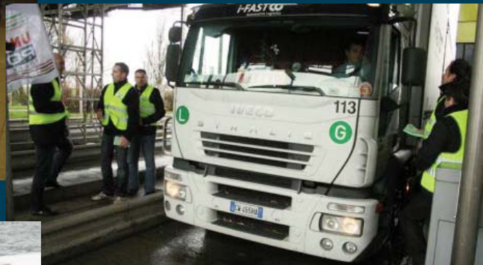
A Fresnes-Les-Montauban !